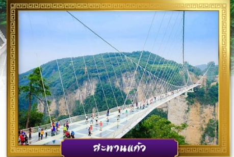
สะพานแก้ว