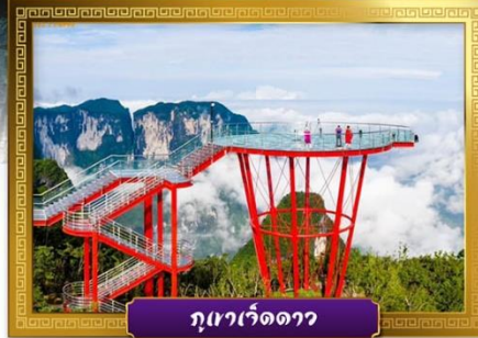
ภูเขาเจ็ดดาว

✓ เดินเล่นถนนคนเดินหวงซิงลู่และซีปู้เจีย